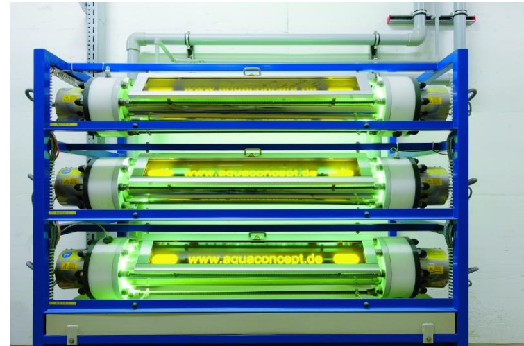
UV - Oxidation